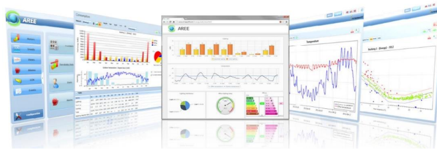
Tableau Energétique :